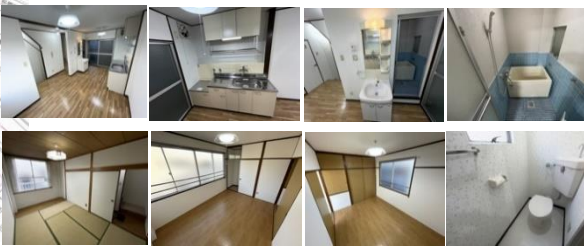
※この図面は物件の概要を記載したものです。図面と現況が異なる場合は現況を優先します。